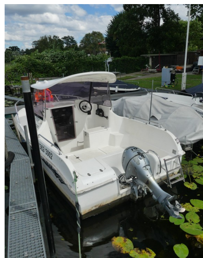
Texas 15 oder 80 PS